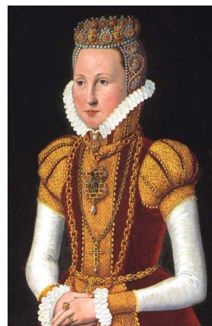
Dronning Sophie o. 1572.

Enkedronningen var Sophie af Mecklenburg (1572-1631), dronning til Danmark og Norge, født 4. september 1557 i Wismar, gift 29. juli 1572 på Københavns Slot 1 med fætter, kong Frederik 2. (1559-1588), forældre til Christian 4. (1588-1648).